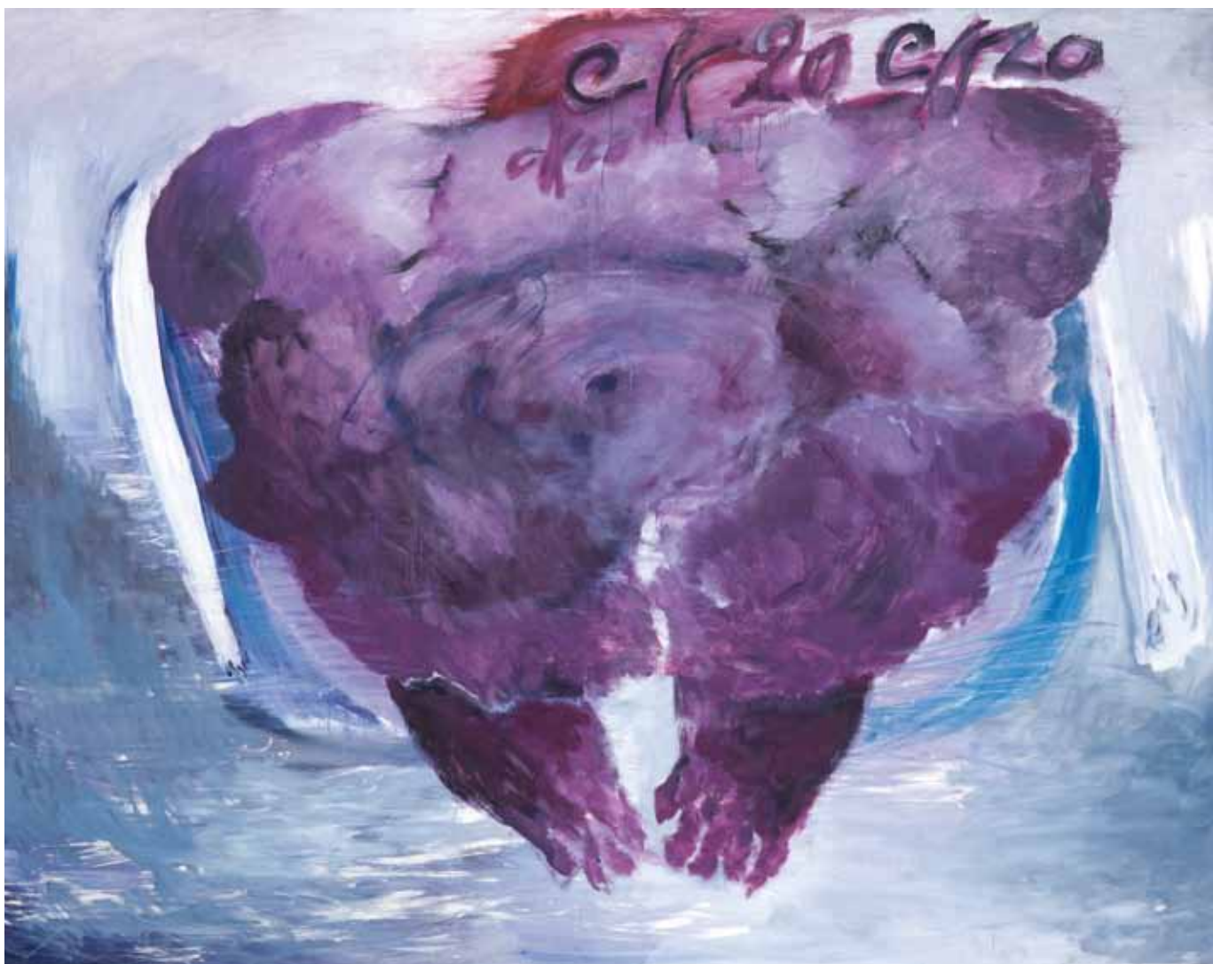
CK20, 2013, olio su tela, cm 202 x 258