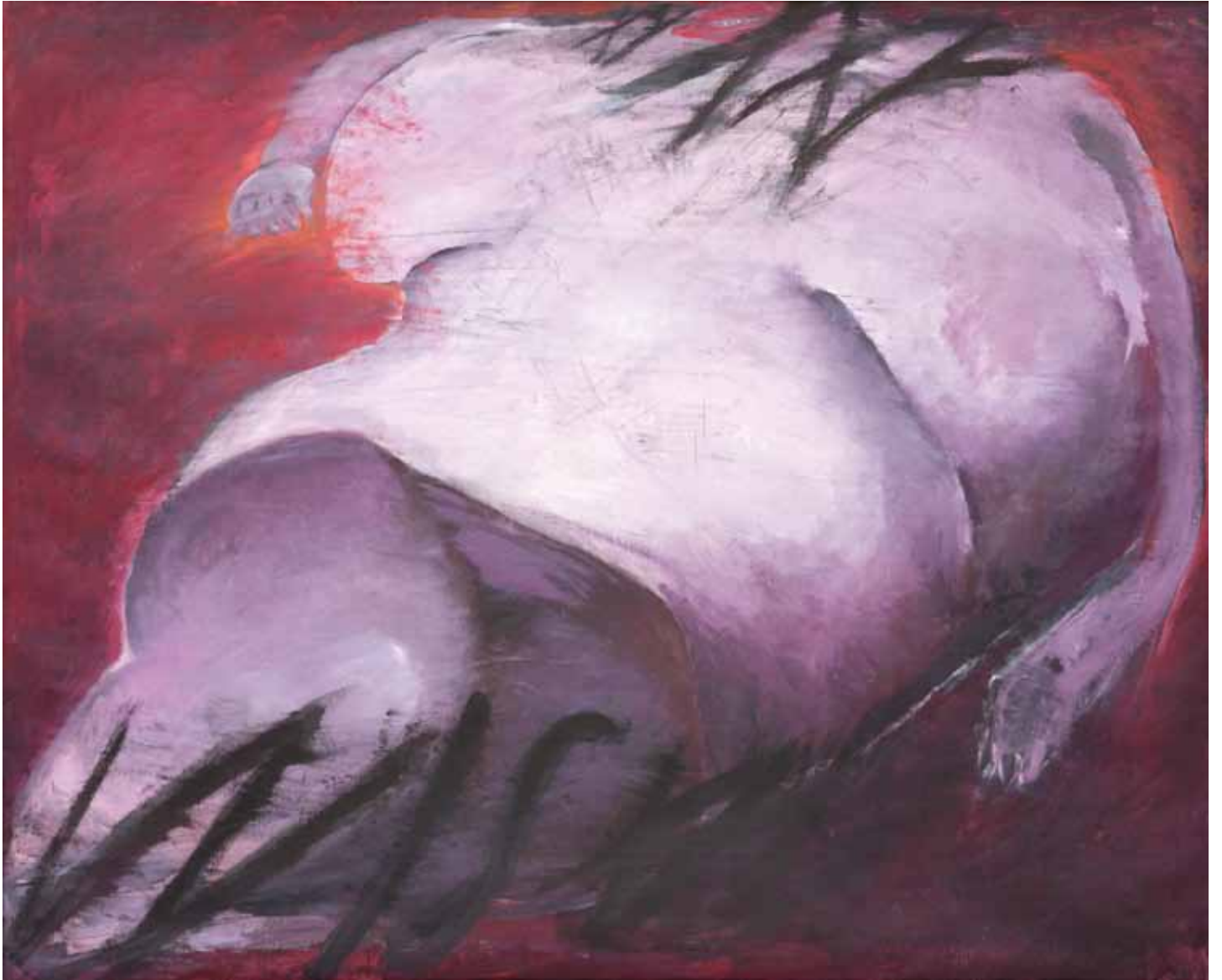
Nudo ingombrante e sereno , 2005, olio su tela, cm 200 x 300