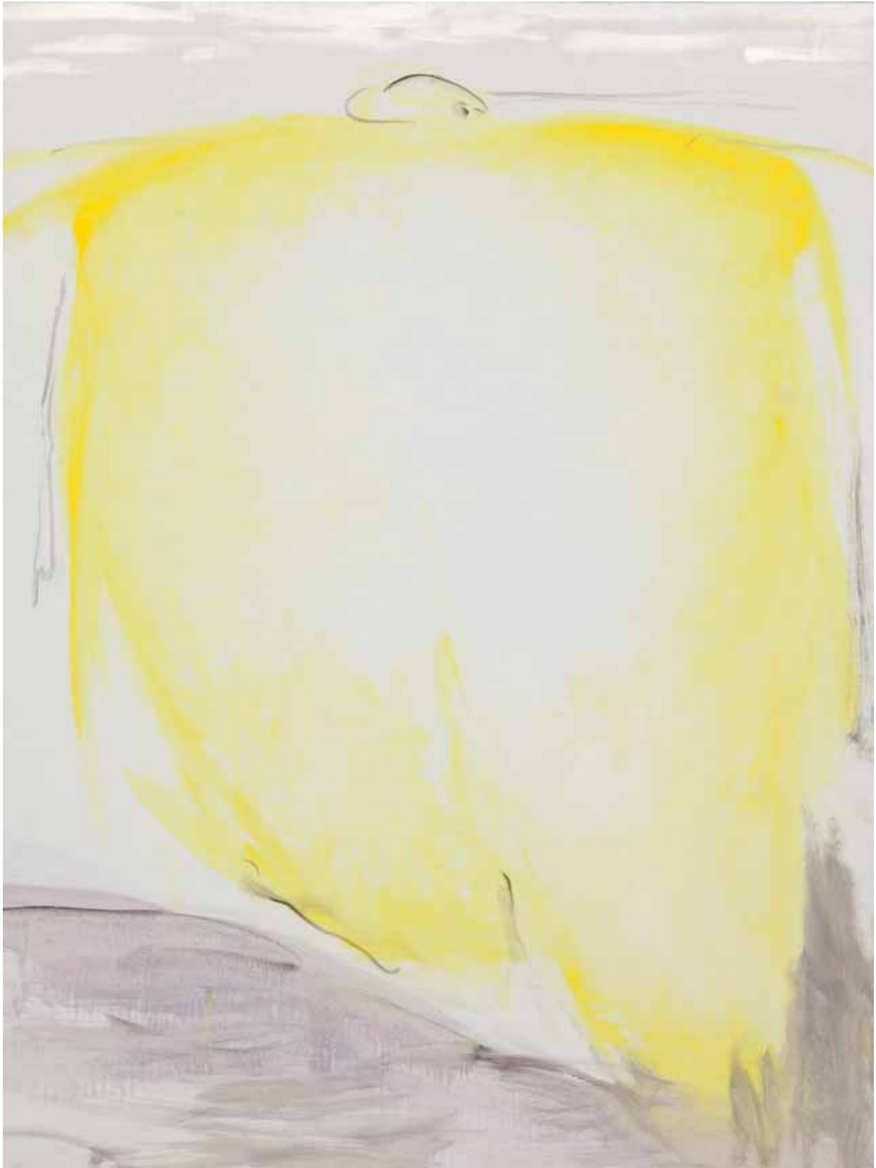
Senza titolo, 2013, olio su tela, cm 165 x 125