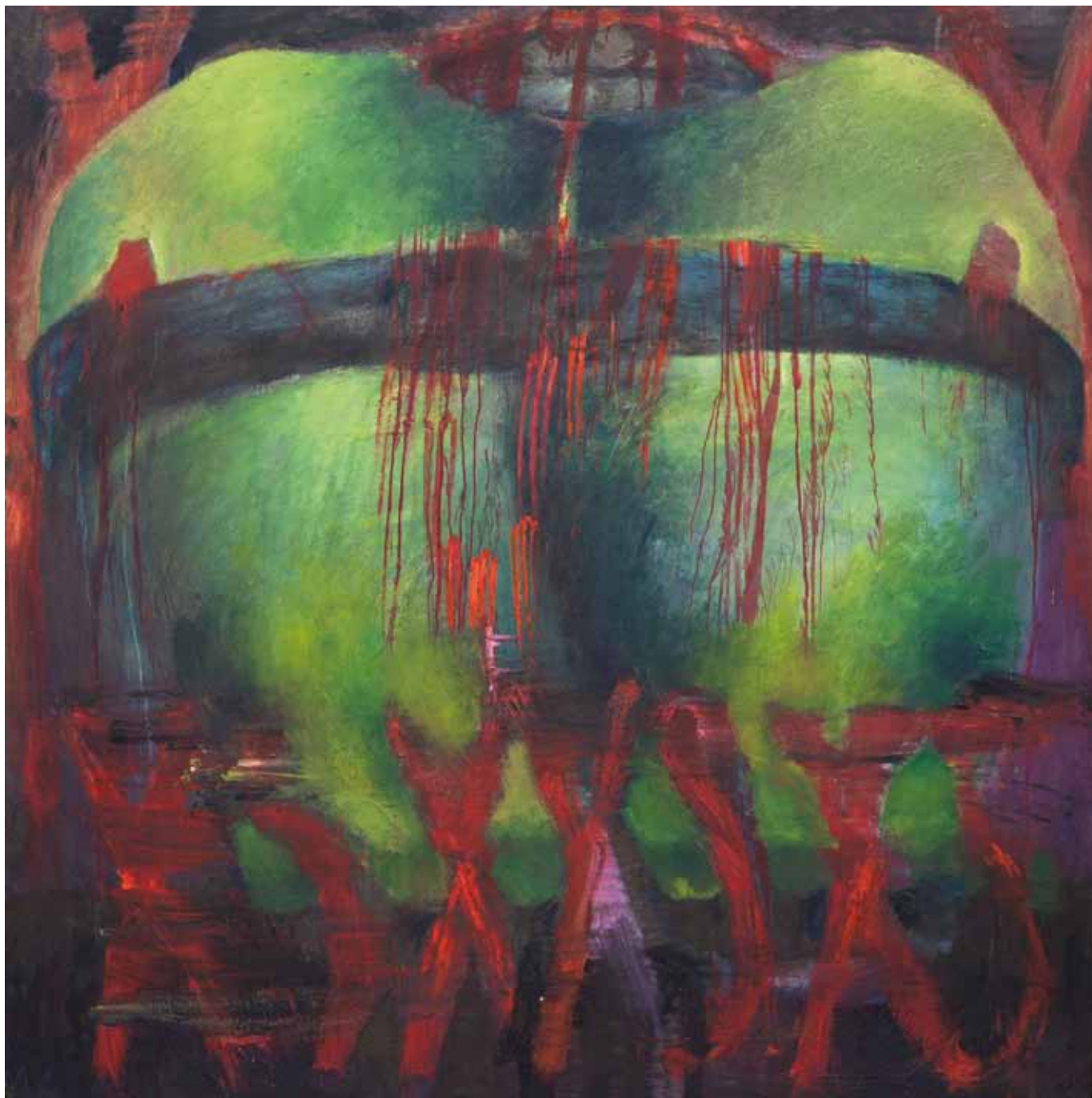
Rosso di sera , 1997, olio su tela, cm 205 x 204