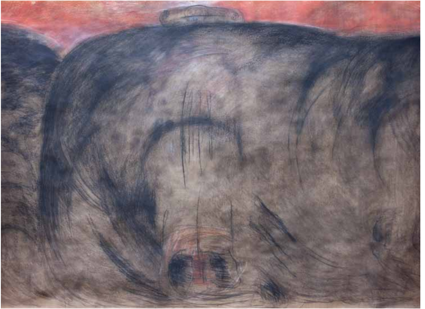
Muro nero (particolare), 1998, carbone e gessi colorati, cm 200 x 960