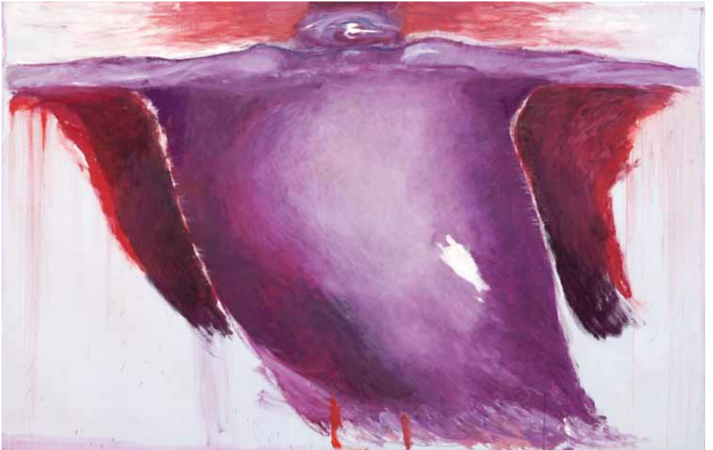
Tra mare e cielo , 2010, olio su tela, cm 200 x 316