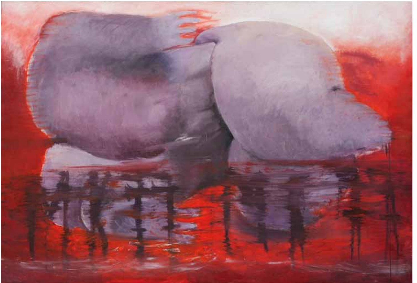
Bellissimo bagno a Tarragona, 2006-07, olio su tela, cm 200 x 300