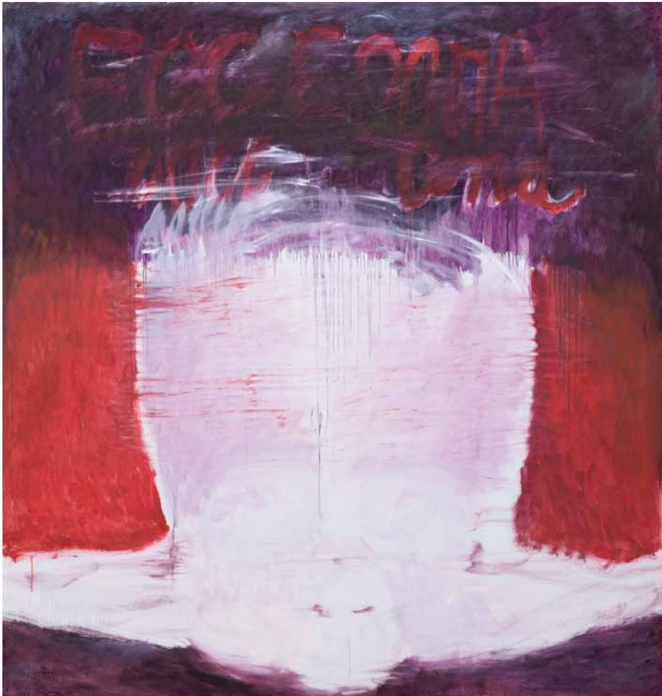
A terra per sempre , 2010, olio su tela, cm 200 x 190