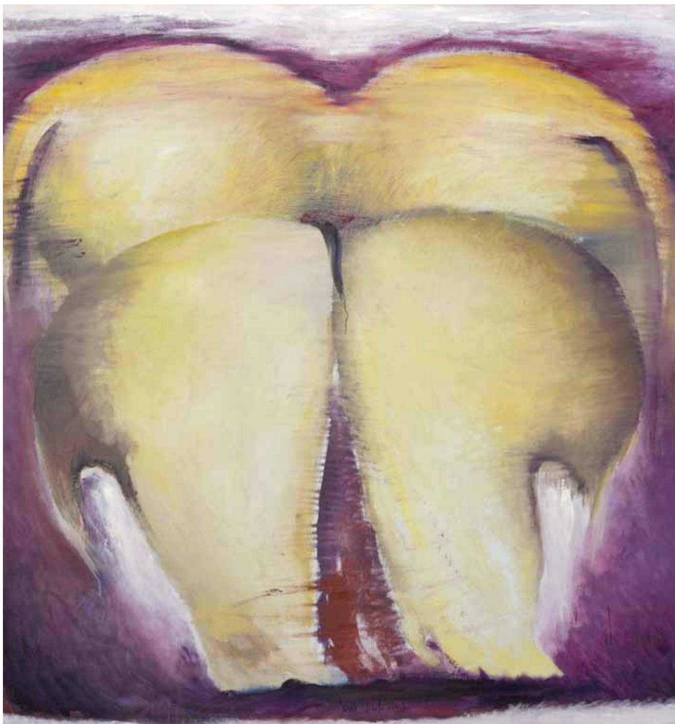
Che fatica! 1 , 2004, olio su tela, cm 210 x 200