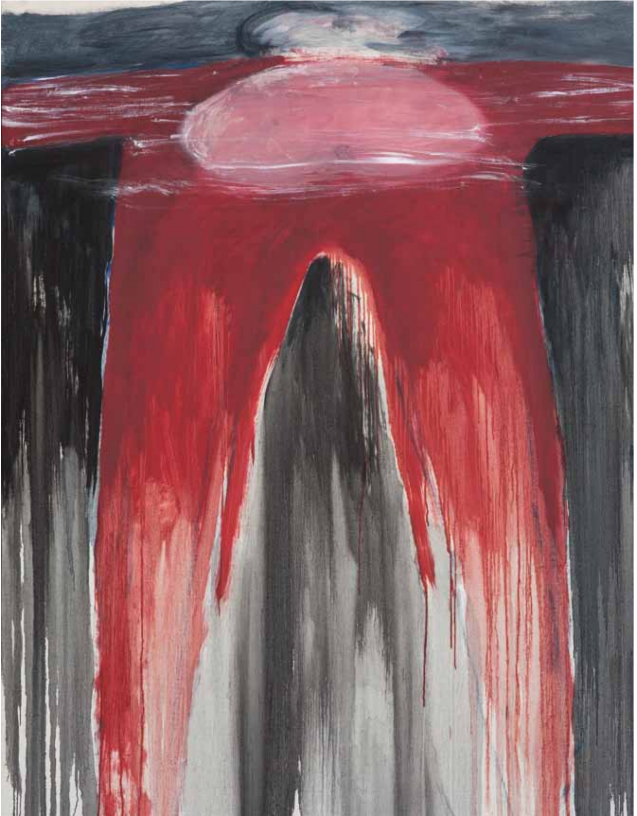
Ecce Donna 1 , 2010, olio su tela, cm 200 x 150