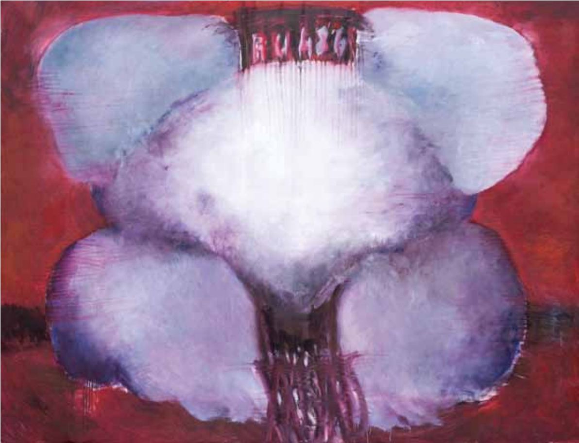
Monumentale , 2007, olio su tela, cm 204 x 265