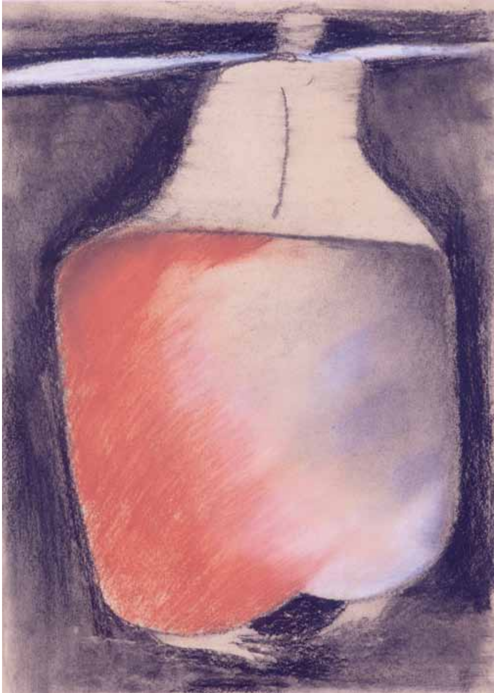
Femminile , 2014, carbone e gessetti colorati, cm 50 x 35