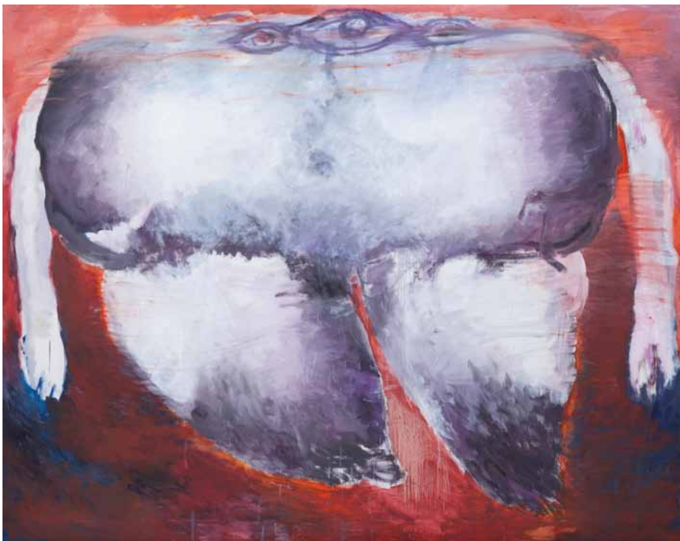
Senza titolo, 2013-14, olio su tela, cm 202 x 258 (incompiuto)