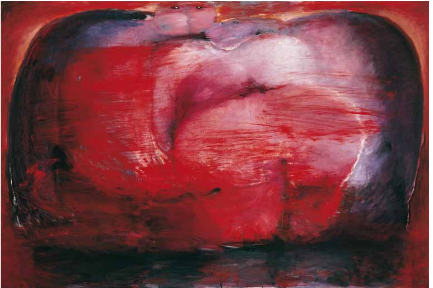
Bella coppia innamorata , 2009, olio su tela, cm 200 x 300