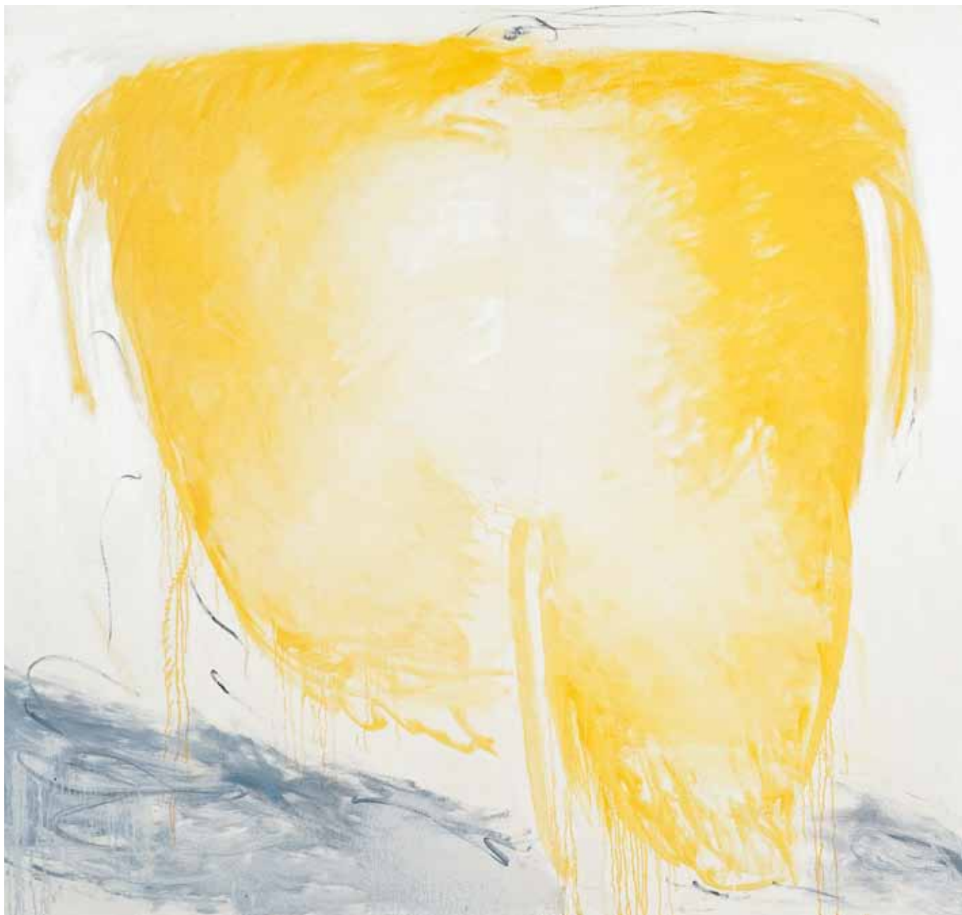
In luce 1 , 2007, olio su tela, cm 196 x 200