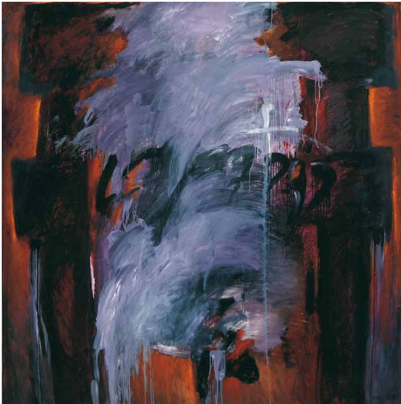
Così impari! (Sedia elettrica) , 1992-93, olio su tela, cm 206 x 206 Accademia Carrara / GAMeC, Galleria d'Arte Moderna e Contemporanea di Bergamo