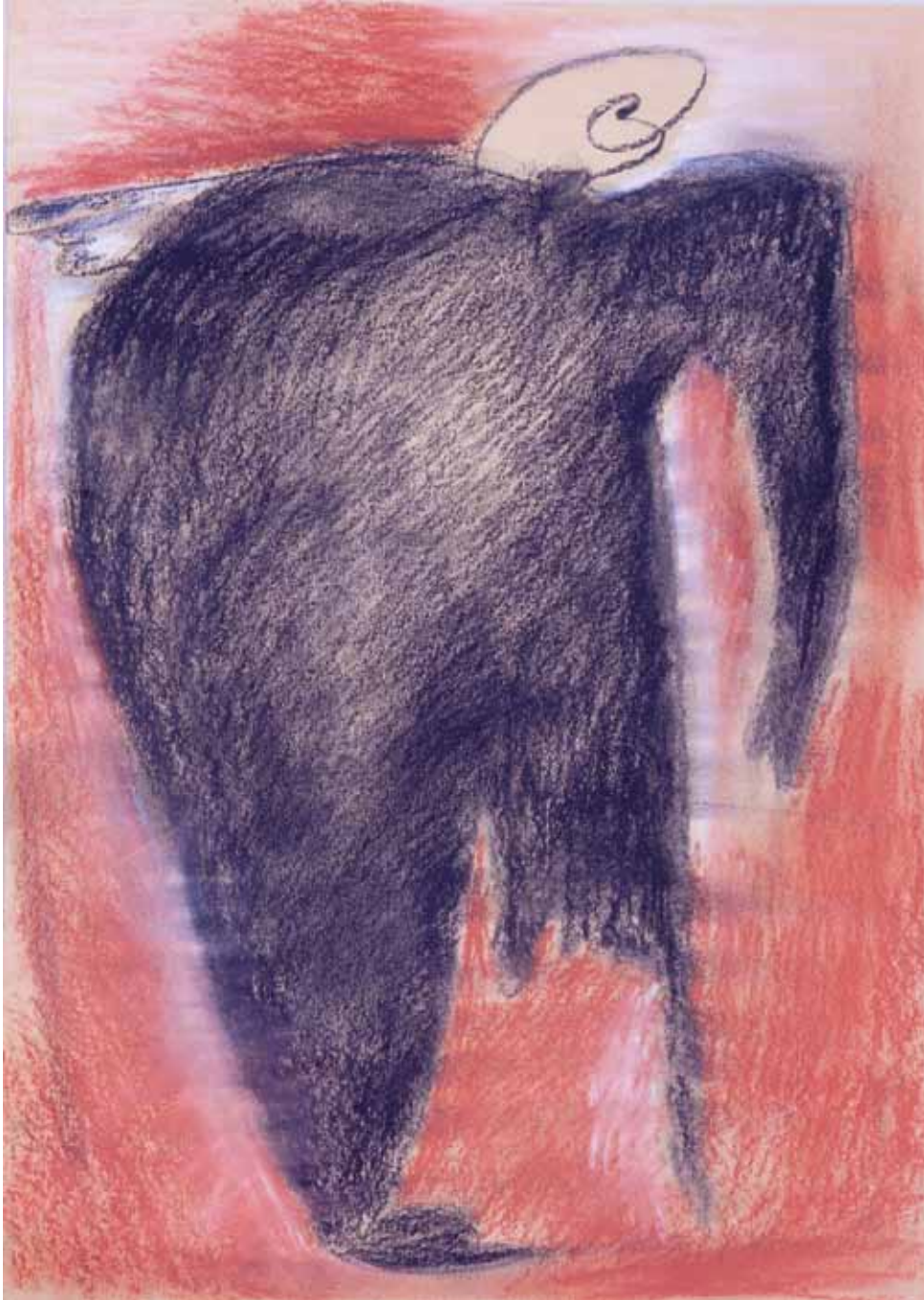
Ritratto di C. , 2014, carbone e gessetti colorati, cm 50 x 35