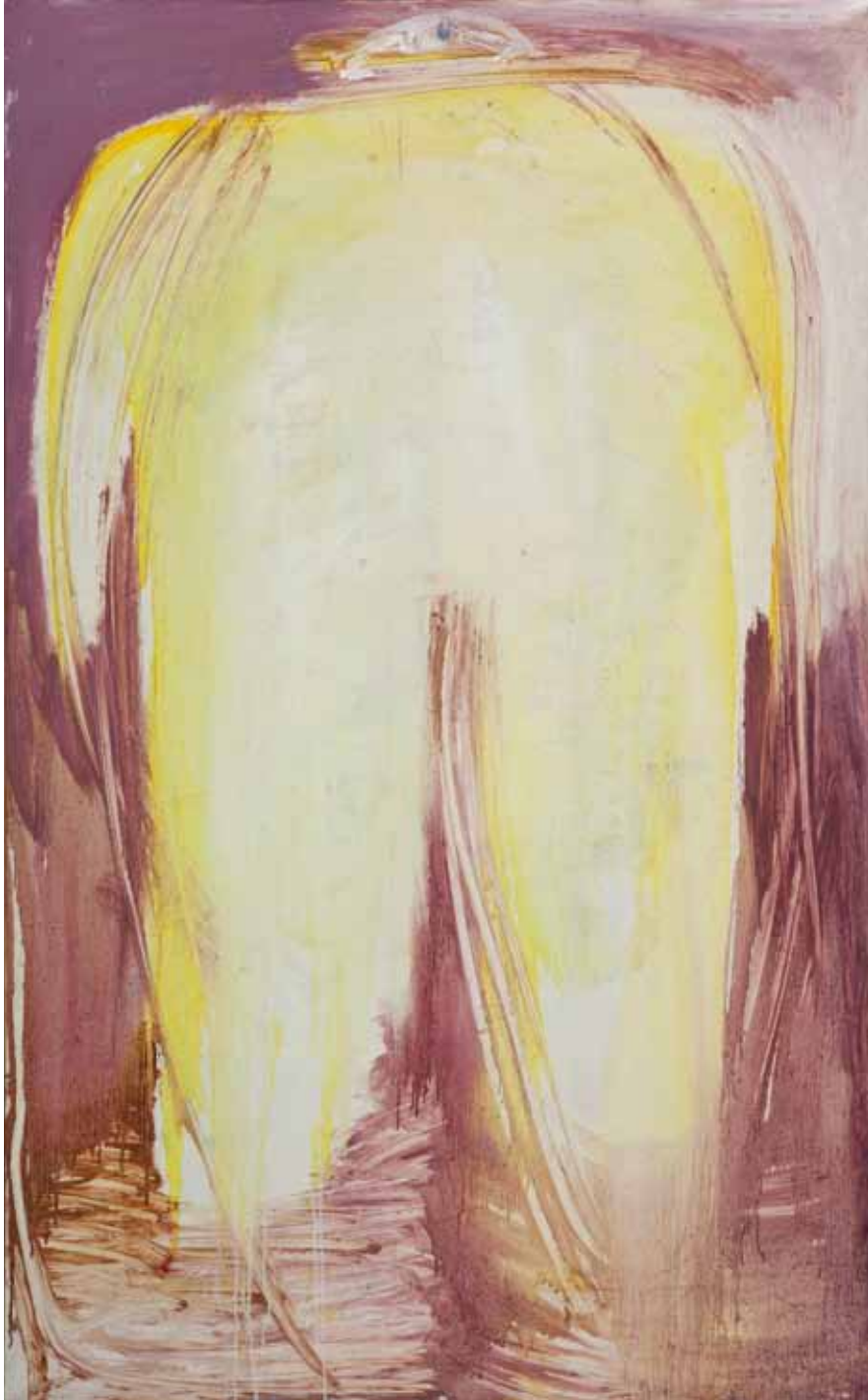
Fantasma , 2008, olio su tela, cm 129 x 79